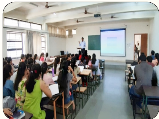
C PROGRAMMING WORKSHOP