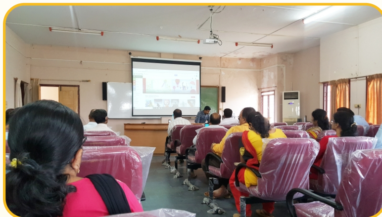
INTERNET AWARENESS PROGRAM