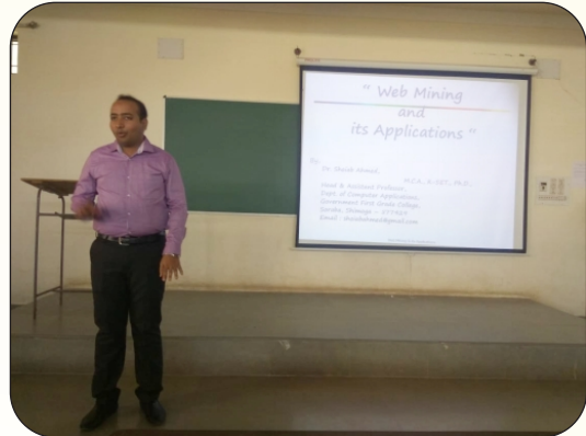
TALK ON WEB MINING