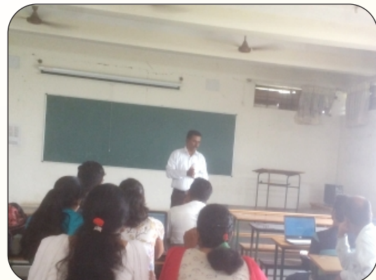
OS INSTALLATION WORKSHOP

Conducted By: Technical staff of ISE department.